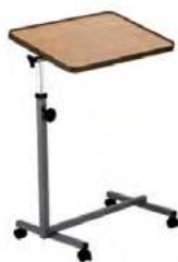
Mesa de alimentación