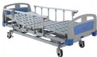
Cama eléctrica de lujo

Aplican restricciones por horario de entrega