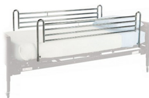
Barandales de protección